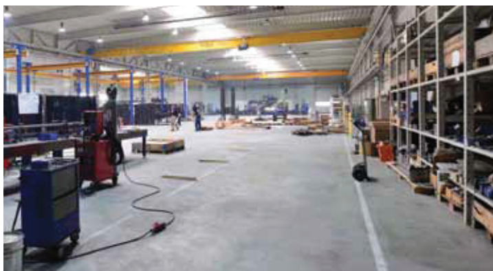
View of Weckenmann production at the Stassfurt-Brumby location in the German federal state of Saxony-Anhalt

Weckenmann Anlagentechnik GmbH & Co. KG Birkenstraße 1 72358 Dormettingen/Germany ☎ +49 7427 9493-0 ✉ info@weckenmann.de 🌐 https://weckenmann.com